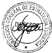
ROBERTO SÁNCHEZ PALOMINO Ministro de Comercio Exterior y Turismo