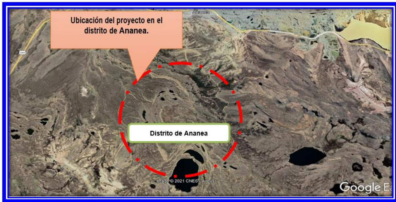
FIGURA N° 02: MICRO LOCALIZACIÓN DE ESTUDIO ACTUAL