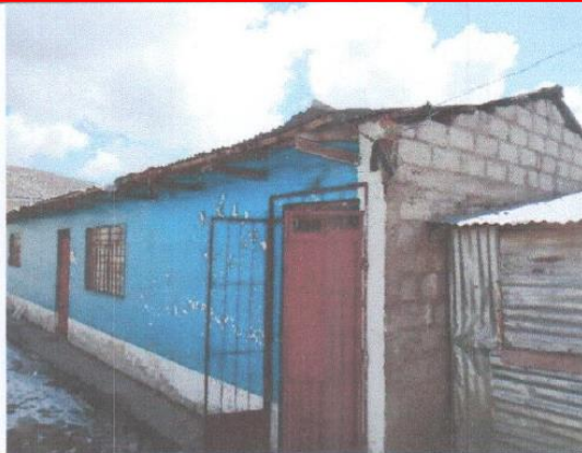
Fotografía N° 06 – En esta imagen se aprecia que la construcción esta con bloquetas y por ende las heladas y el frio se siente en el interior.