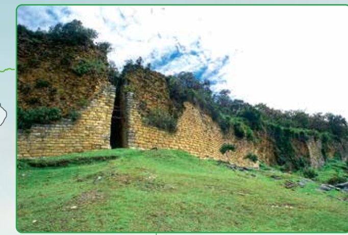
Fortaleza de Kuélap

El sistema de telecabinas es ecoamigable. Nos dará acceso de forma cómoda y rápida al resto arqueológico más importante de la cultura Chachapoyas: la Fortaleza de Kuélap. Además, impulsará el turismo hacia la región Amazonas consolidando el circuito turístico nororiental del Perú.