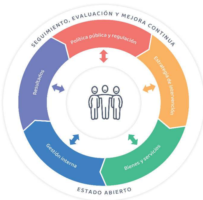
Gráfico N° 2: Modelo conceptual de la PNMGP al 2030

En el marco del paradigma de la nueva gobernanza, la PNMGP al 2030 plantea un modelo conceptual basado en la lógica de la cadena de valor público, el cual facilita contar con una aproximación holística para comprender las decisiones de política y estrategias de intervención que se adoptan desde el Estado para resolver un determinado problema público; el funcionamiento de las entidades públicas (en términos de su gestión interna), los productos que generan (en términos de los bienes, servicios y regulaciones) y los resultados que permitirán generar los cambios esperados en el bienestar de las personas y de la sociedad. Del mismo modo, a través de dicho enfoque, se busca transmitir que las intervenciones públicas en el territorio no son solo el resultado del rol preponderante que asume una entidad pública, sino que resulta – sobre todo – de los distintos procesos de gobernanza que se establezcan entre entidades públicas, organizaciones del sector privado y las personas (PNUD, 2015). Véase gráfico N° 2: