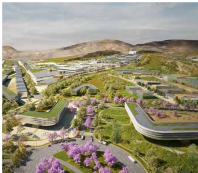
Proyección 3D del proyecto Parque Industrial de Ancón

PROINVERSIÓN viene fortaleciendo la atracción de inversiones del exterior a través de Roadshows y/o participación en diversos eventos internacionales para asegurar la competencia y éxito de los concursos públicos internacionales de proyectos de Asociaciones Público – Privadas (APP) y Proyectos en Activos. Este periplo se integra a los ya realizados recientemente en Europa y América Latina con el objetivo de atraer empresas globales interesadas en invertir en la variada cartera de proyectos de APP y Proyectos en Activos que la agencia viene promoviendo.