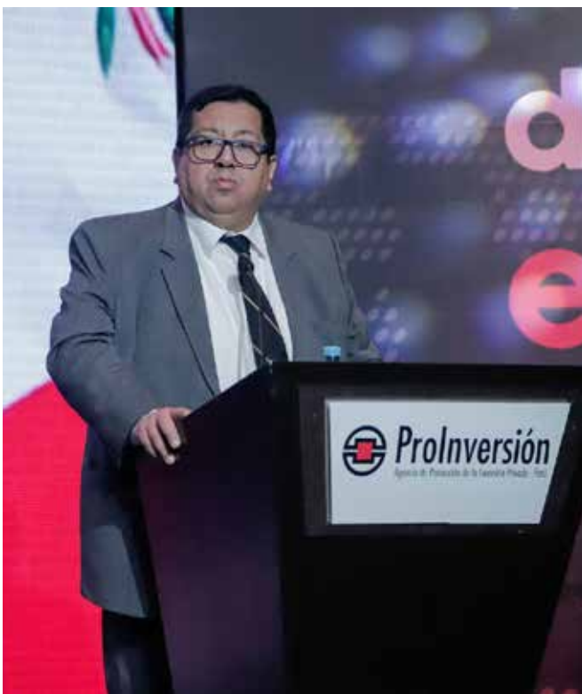
Alex Contreras, Ministro de Economía

Además, PROINVERSIÓN anunció que vienen trabajando con los ministerios, entidades y gobiernos locales en generar una cartera diversificada, con énfasis social y acorde a las necesidades de cierre de brechas. Como consecuencia de ello, para el periodo 2025-2026, cuentan con 15 proyectos adicionales por más de US$ 6,700 millones, entre los que se destacan proyectos de irrigación, salud, colegios, plantas de tratamiento de aguas residuales y desaladoras.