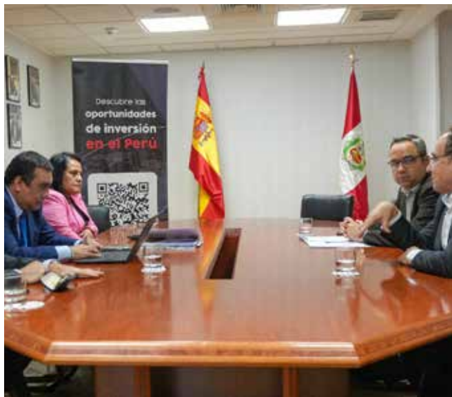
Presentación de Cartera de proyectos en Madrid

Destacaron los proyectos como Obras de Cabecera, las Plantas de Tratamientos de Aguas Residuales, plantas desaladoras, los hospitales encargados por el Ministerio de Salud que promueve la entidad, así como la Carretera Longitudinal de la Sierra Tramo 4, Ferrocarril Huancayo Huancavelica y el Anillo Vial Periférico, entre otros.