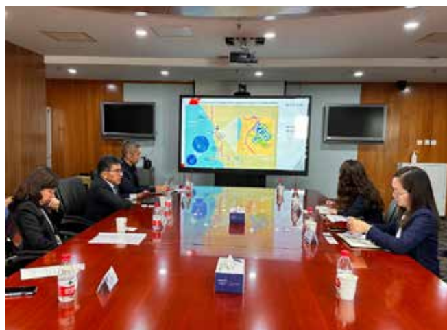
Reunión con los ejecutivos de China Export & Credit Insurance Corporation

En las tres ciudades, la delegación peruana presentará el portafolio de 55 proyectos APP y Proyectos en Activos 2024-2026 por alrededor de US$ 15,000 millones, además de sostener reuniones bilaterales con inversionistas, desarrolladores de proyectos, ejecutivos de banca de inversión, consultores, entre otros, del sector energía, transportes, educación, salud, agua y saneamiento.