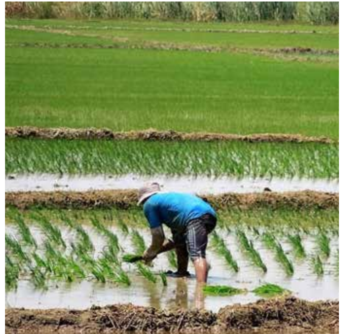
Foto referencial de centro de irrigación

Gracias al convenio, PROINVERSIÓN ha reiniciado el trámite de la mencionado IPC hasta su declaratoria de interés y posterior adjudicación. El proyecto permitirá recuperar alrededor de 500 millones de metros cúbicos de agua que actualmente se pierden en el mar o se infiltran desde los canales sin revestir o campos de cultivo, lo que hará posible retener más excedentes de agua en los embalses y su aprovechamiento en el mejoramiento del riego en el valle e incorporación de tierras nuevas.