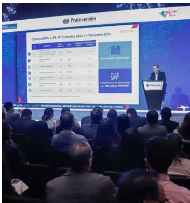
El director ejecutivo de PROINVERSIÓN, José Salardi, exponiendo cartera APP Y PA del IV Trimestre 2023 - I Trimestre 2024

Precisando que la primera meta de PROINVERSIÓN para el próximo año, es adjudicar al cierre del primer trimestre, seis proyectos APP de gran impacto para el país que reúnen un monto total de inversión estimada de más de US$ 4,800 millones, para luego adjudicar durante el segundo y cuarto trimestre, 34 proyectos más por una inversión superior a los US$ 3,100 millones.