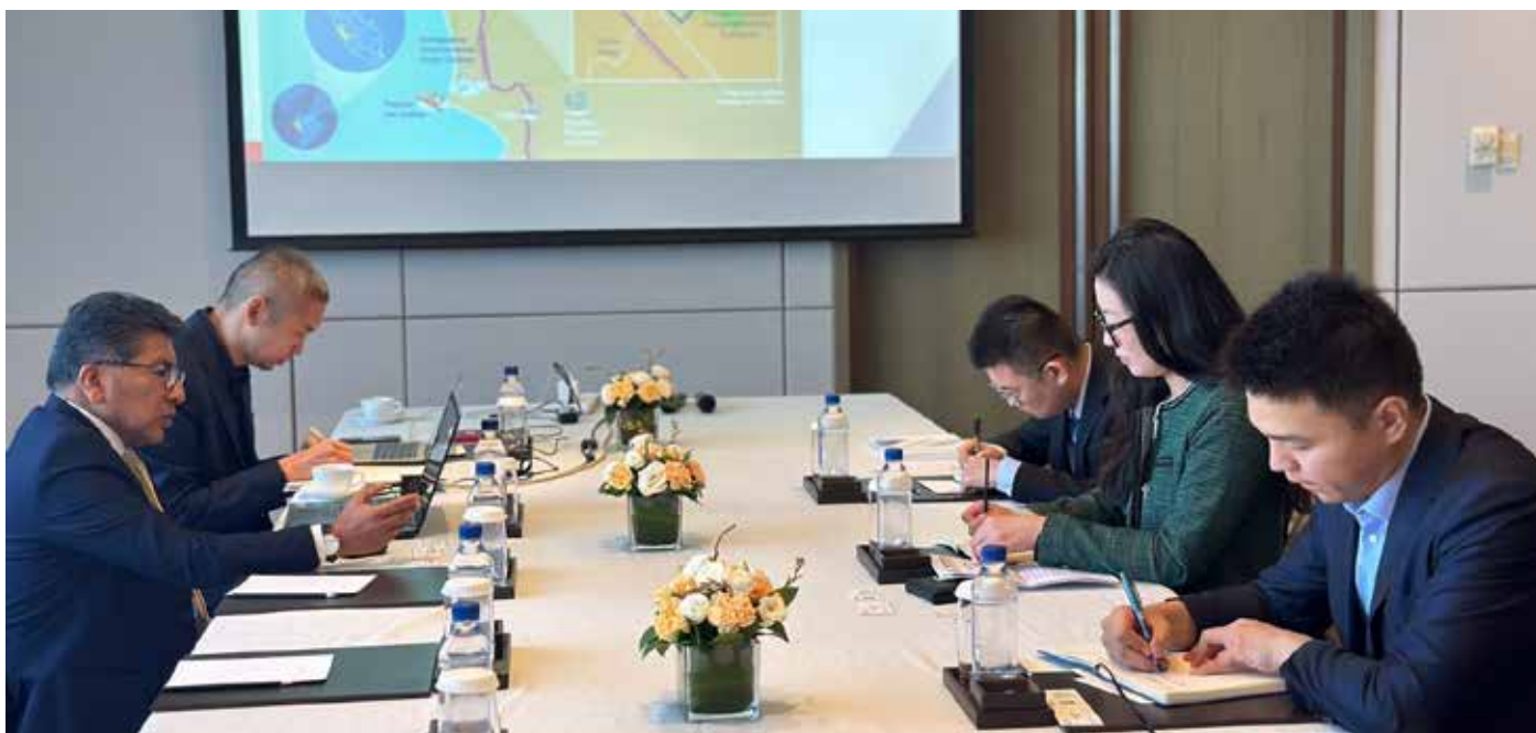
Reunión técnica informativa con ejecutivos de la empresa Powerchina International Engineering Co., Ltd.