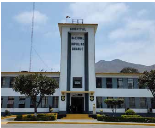
Hospital Nacional Hipólito Unanue