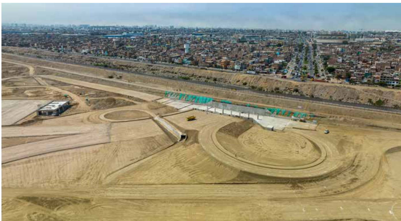
Vista aérea proyecto Puente Santa Rosa