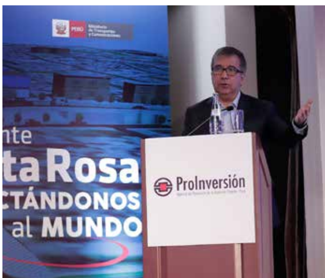
Ministro del MTC, Raúl Pérez Reyes

PROINVERSIÓN viene brindando la asistencia técnica y legal al equipo del MTC, para que el proyecto pueda ser convocado a concurso público y se adjudique en el más breve plazo.