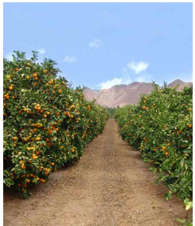
Foto referencial de centro de irrigación

En una segunda etapa, con la viabilidad del proyecto en el marco del Invierte.pe y su calificación para ser desarrollado como APP, PROINVERSIÓN se encargará, conforme al convenio, de la conducción de las fases de estructuración y transacción hasta la adjudicación.