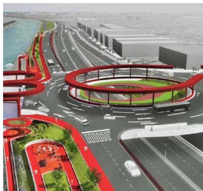
Proyección 3D del proyecto Puente Santa Rosa

Adicionalmente, el titular del MTC reveló que cuentan con otros siete proyectos de transportes y telecomunicaciones, por S/ 1,871 millones, para ser ejecutados mediante Obras por Impuestos y que están a la espera de empresas financieristas. Entre estos destacan cinco proyectos de Instalación de Banda Ancha para la conectividad y desarrollo social en Cajamarca, Piura, Tumbes y Loreto (dos proyectos).