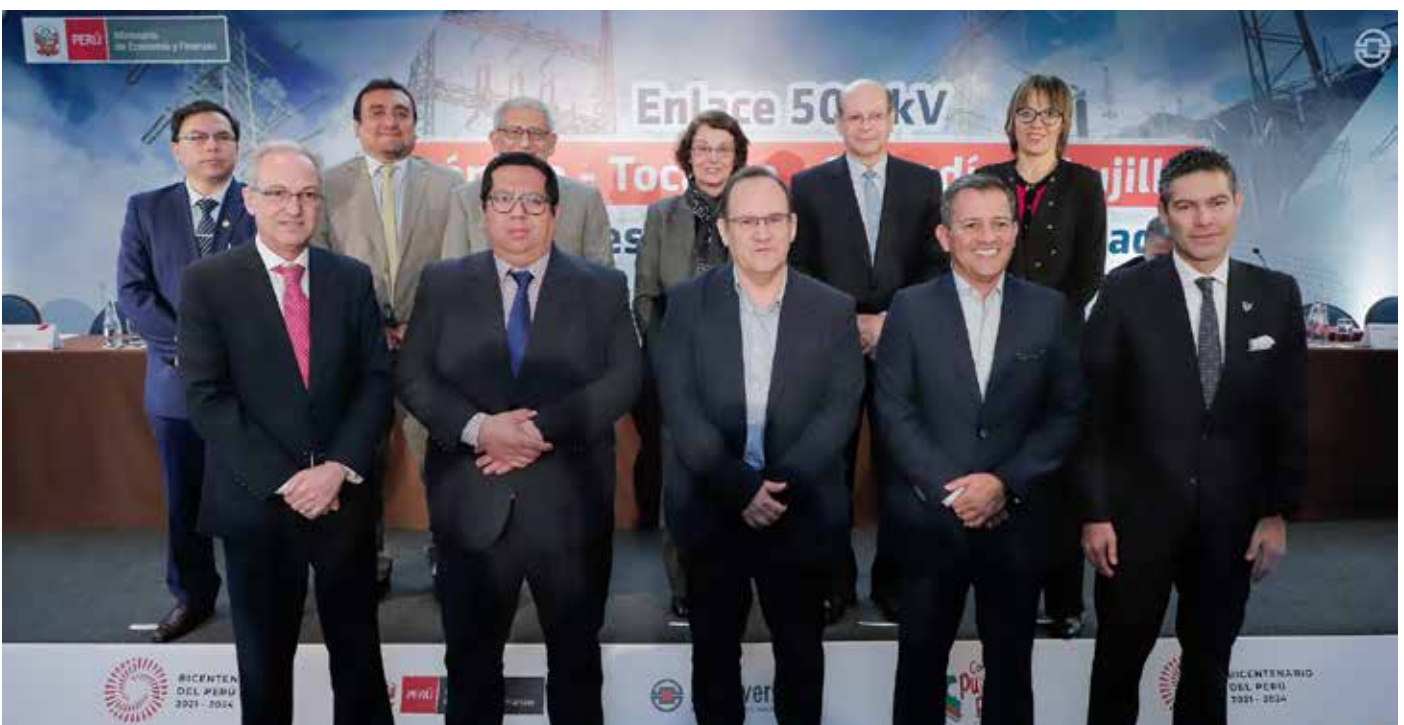
Acto público del proceso de adjudicación de los 2 proyectos de transmisión eléctrica: “Enlace 500 kV Huánuco – Tocache – Celendín – Trujillo, ampliaciones y subestaciones asociadas, y Enlace 500 kV Celendín-Piura, ampliaciones y subestaciones asociadas”