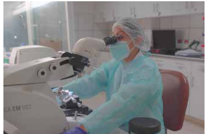
Foto referencial modernización hospital

“ El operador privado será responsable del mantenimiento de la infraestructura y el equipamiento; así como la gestión de los servicios generales ”.