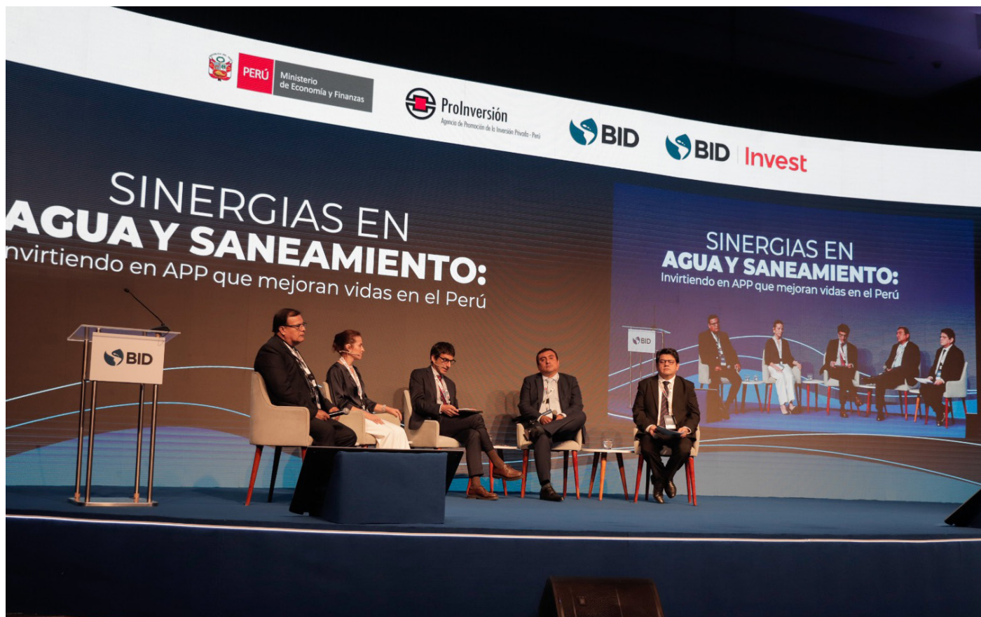
Evento Sinergias en agua y saneamiento : Invirtiendo en APP que mejoran vidas en el Perú

Según el BID, el Perú lidera en América Latina y el Caribe la selección y priorización de proyectos APP en el marco de su Plan Nacional.