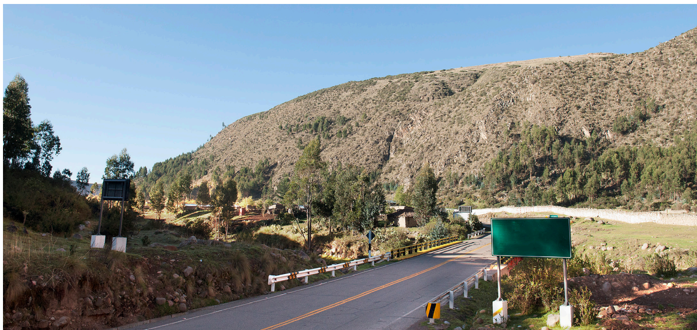
Longitudinal de la sierra Tramo 4

La ejecución del proyecto reducirá los costos logísticos y de movilización de bienes y personas, mejorando la calidad de vida de más de 1.6 millones de peruanos de las cinco regiones, facilitando el acceso a servicios públicos y brindando oportunidades económicas.