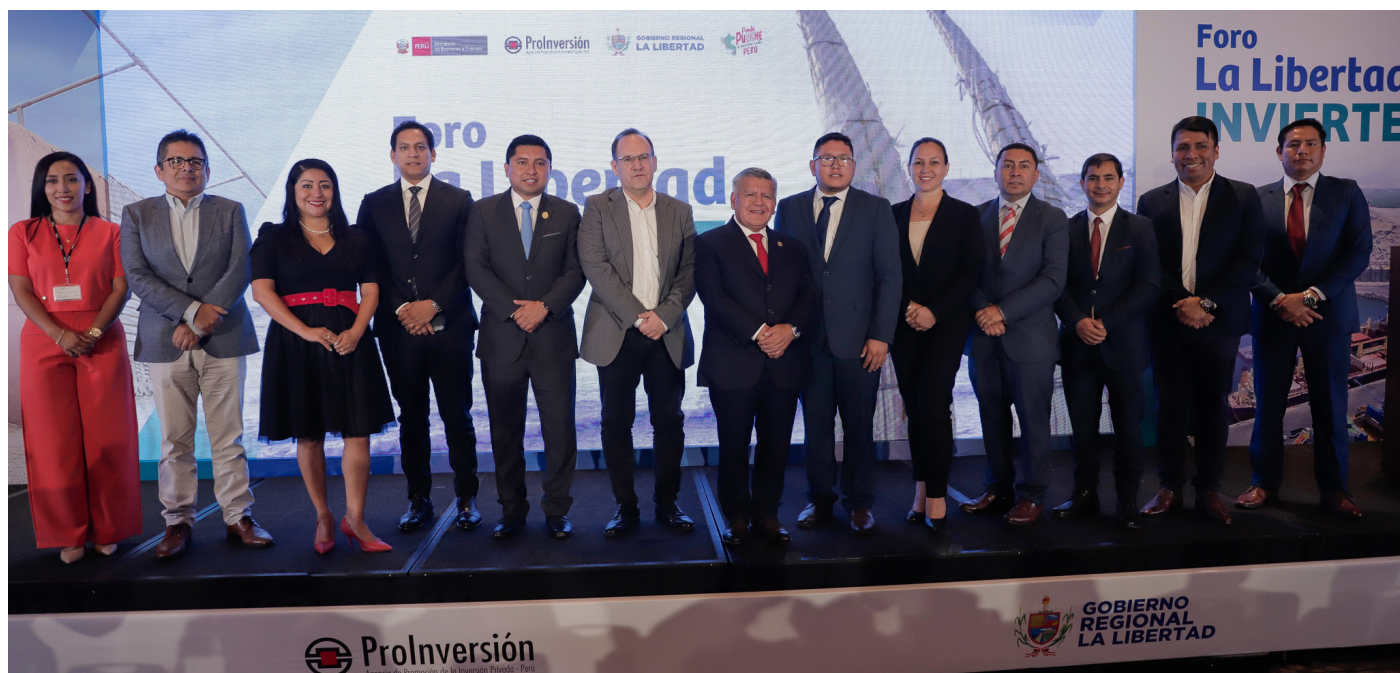
Foto protocolar tras el Foro La Libertad invierte

El Gobierno Regional de La Libertad presentó: dos proyectos APP por US$ 180 Millones (S/ 669 millones); tres Proyectos en Activos por US$ 405 millones (S/1,506 millones) y 42 iniciativas de Obras por Impuestos por S/ 1,221.5 millones en salud, educación, infraestructura vial, irrigación, entre otros.