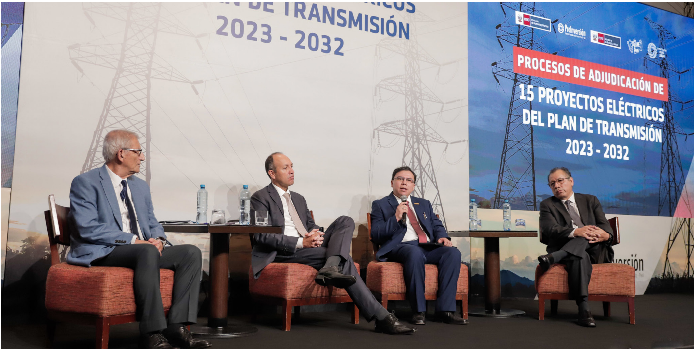
Procesos de adjudicación de 15 proyectos eléctricos del plan de transmisión 2023-2032

Los proyectos están asociados en cuatro grupos a ser adjudicados en 2024 y beneficiarán a más de 8 millones de personas de nueve regiones del país.