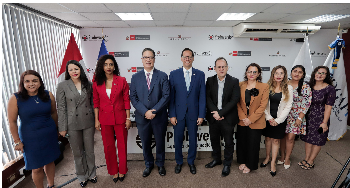
Foto protocolar tras la colaboración interinstitucional