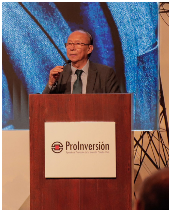
Jaime Luyo Kuong, Viceministro de Electricidad

La concesión de estos proyectos, bajo la modalidad de Asociación Público-Privada (APP), permitirá fortalecer y mejorar la confiabilidad de los sistemas de transmisión eléctrica, así como proporcionar una mejor calidad de servicio a las industrias, comercios y servicio, y a miles de hogares de las regiones beneficiarias.