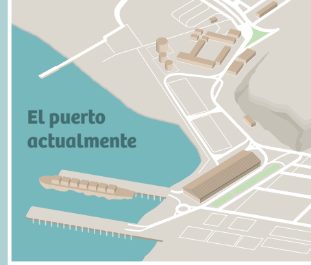
El puerto actualmente