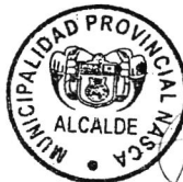
EUSEBIO ALFONSO CANALES VELARDE Alcalde Municipalidad Provincial de Nasca